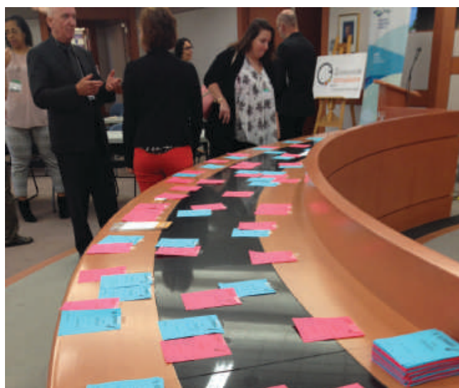
Figure 3: Atelier de maillage réalisé en partenariat avec la CMQ

Le CRE – Capitale-Nationale a participé à deux événements, en collaboration avec d'autres groupes environnementaux de la Ville de Québec, afin de consolider la prise de position PRO-Consigne du RNCREQ sur notre territoire. La journée de sensibilisation du 16 mars 2019 et l'entrevue radio du 22 mars 2019 avaient pour but de rappeler aux citoyens les principaux arguments économiques, sociaux et environnementaux en faveur de l'élargissement de la consigne aux contenants de verre au Québec.