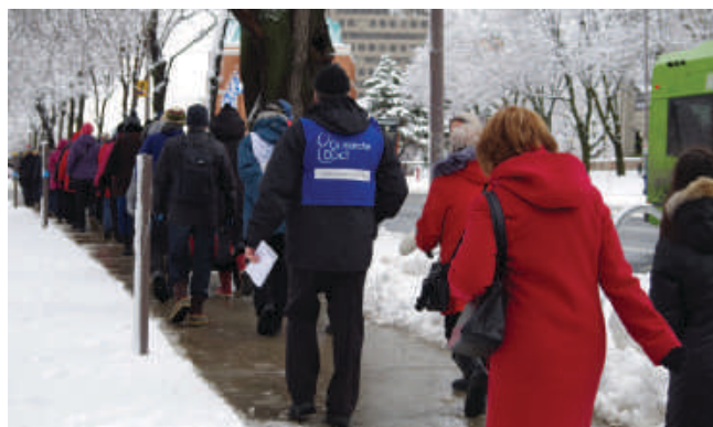
Figure 6 : Marche hivernale Ça marche Doc!

Depuis le lancement officiel du projet en septembre 2016, plusieurs phases se sont succédées. La première phase comprenait une série de 36 chroniques à la radio de Radio-Canada et des marches hebdomadaires qui se sont poursuivies dans les autres phases. Chaque semaine, une marche urbaine a lieu le samedi matin entre 10h et 11h dans les différents quartiers du territoire des villes de Québec et de Lévis. En se déplaçant de la sorte de quartier en quartier au fil des semaines, cela a permis d'interpeller l'ensemble de la population du territoire urbanisé de Québec et Lévis. En moyenne, le taux de participation aux marches de la phase 2 a été autour de 70 personnes chaque semaine. Environ 90 marches ont été organisées jusqu'à ce jour. Au début du projet, nous devions aller cogner aux portes des organismes du milieu pour proposer les marches. Maintenant, nous recevons des demandes pour organiser des marches (ex. Ville de l'Ancienne-Lorette, Ville de Boischatel, ministère de la Forêt, de la Faune et des Parcs, Fondation québécoise du cancer, Fondation du cancer du sein du Québec, Domaine de la Pointe-Saint-Vallier, Réserve du Marais-Léon-Provancher, Société d'histoire de Sillery, CERFO, Jour de la terre, etc.).