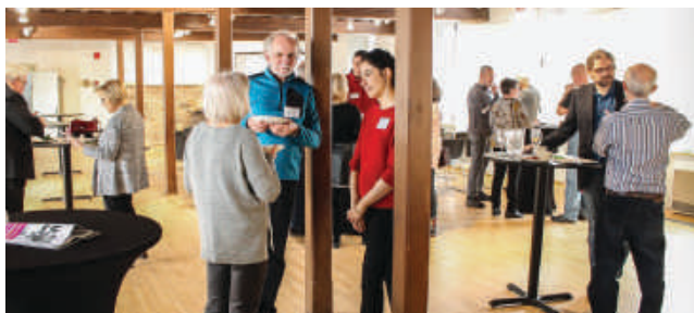
Figure 4 : Cocktail dînatoire au Domaine Maizerets

Cette année, une nouvelle formule a été mise de l'avant et tous les propriétaires ayant une entente de protection depuis le début du projet ont été invités à un cocktail dînatoire d'un avant-midi au Domaine Maizerets, le 23 mars 2019. Une présentation du CRE – Capitale-Nationale sur l'importance des milieux humides et les options de conservations a été présentée aux propriétaires sur place. La formule sera répétée annuellement puisque cela permet de consolider et entretenir le dialogue entre les propriétaires et le CRE – Capitale-Nationale. Il s'agit également d'une opportunité pour sensibiliser davantage les propriétaires.