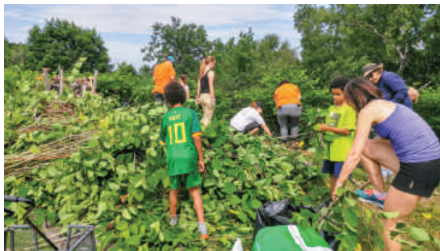
Figure 5 : Arrachage de renouée du Japon

La campagne J'en arrache! lancée à l'été 2018 visait ainsi à sensibiliser les citoyens habitant en périphérie du coteau sur la problématique des plantes exotiques envahissantes et à leur donner les outils nécessaires pour les reconnaître et s'en départir convenablement. Des interventions d'arrachages de la renouée du Japon et de lamier jaune ainsi que des plantations d'arbustes ont également été effectuées avec des bénévoles et des citoyens