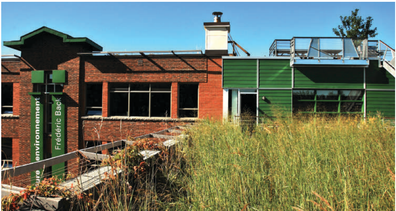
Figure 1 : Le Centre culture et environnement Frédéric Back

De nombreux élus municipaux et provinciaux ainsi que des professionnels de divers horizons ont été rencontrés à travers la région. De plus, les employés ont assisté à plusieurs événements, tels que le Colloque d'Environnement Jeunesse et le Colloque annuel de l'Institut Hydro-Québec en environnement, développement et société.