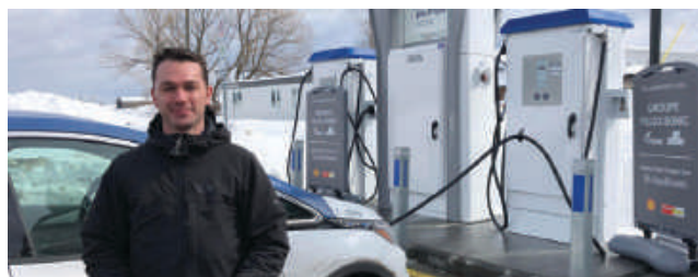
Figure 2 : Inauguration de la superstation de recharge rapide pour véhicules électriques à St-Apollinaire

Finalement, sur le plan de la gouvernance, le respect des plus hauts standards règlementaires est de mise. Une planification intégrée à une vision cohérente doit être établie entre les différents paliers gouvernementaux. Bref, une série de recommandations de bonnes pratiques a été produite.