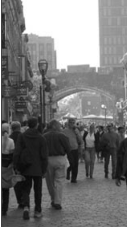
Rue Saint-Jean lors de la journée

La population pouvait enfin respirer et se balader au milieu de la rue! Les enfants ont dessiné sur les pavés pendant que les autres participants ont pu essayer des vélos électriques, assister au spectacle de Polémil Bazar, voir des démonstrations de monocycles et des expositions de véhicules alternatifs pour ne nommer que cela. L'ambiance était à la fête, un mercredi de surcroît!