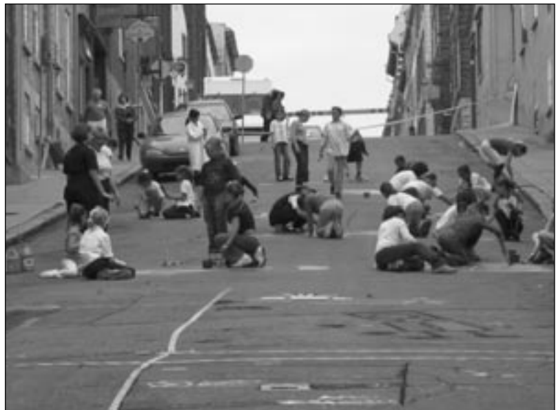
La rue aux enfants

Ce type de journée permet à la population de se réapproprier la rue et de voir comment serait la vie urbaine s'il y avait moins de place consacrée à l'automobile. De plus, cette journée permet d'essayer de nouveaux modes de transport moins polluants, de se sensibiliser aux changements climatiques, de mieux respirer et d'être les acteurs d'un changement de mentalité.