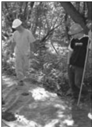
Aménagement du sentier pédestre

Toujours dans le but de permettre l'accès aux merveilles qu'offre le site de la rivière Beauport au plus grand nombre de personnes, le CVRB poursuit l'aménagement d'un sentier pédestre situé au nord de l'autoroute Félix-Leclerc. Réalisé dans le cadre du Chantier urbain de la Ville de Québec, ce projet, qui en est à sa deuxième phase de développement, longe la portion de la rivière qui s'étend de la rue Clemenceau à la rue Saint-Joseph. Sillonnant les berges de ce lieu enchanteur, le sentier révèle des richesses jusqu'à ce jour encore ignorées. Le sentier offrira aux visiteurs un jardin d'oiseaux, un sentier de 2,5 km, des panneaux d'interprétation et la possibilité de contempler toutes les beautés d'une faune et d'une flore dissimulées en plein cœur de la ville.