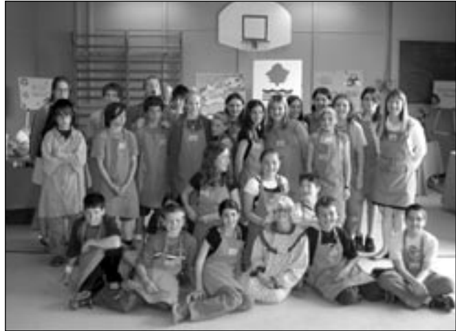
École L'Arc-en-Ciel de Saint-François-Xavier-de-Brompton, le 20 mai 2004.